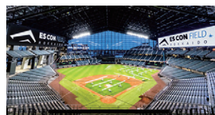
エスコンフィールドHOKKAIDO