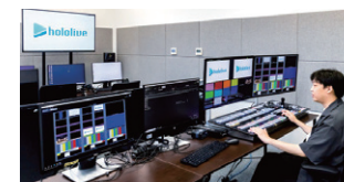
カバー (VTuberプロダクション)