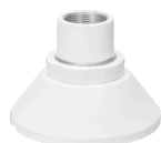
WV-QSR506F-W カメラ吊り下げ金具 ISO メネジ