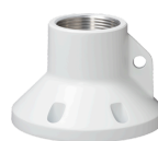
WV-QCL100-WUX カメラ天井吊り下げ 金具