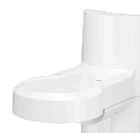
WV-QWL502-W カメラ壁取付金具