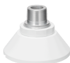
WV-QSR506M-W カメラ吊り下げ金具 ISO オネジ