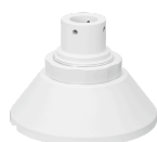
WV-QSR506S-W カメラ吊り下げ金具 耐重塩害