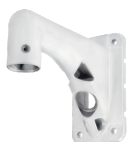
WV-QWL501S-W カメラ壁取付金具 耐 重塩害