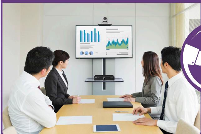
ビデオ会議 HDコム（社内）