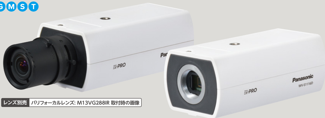
レンズ別売 パリフォーカルレンズ: M13VG288IR 取付時の画像