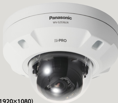
屋外対応 フルHD (1920×1080)