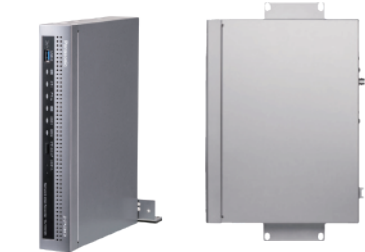
縦置きイメージ 壁取り付けイメージ (幅280 mm×高さ44 mm×奥行き212 mm)