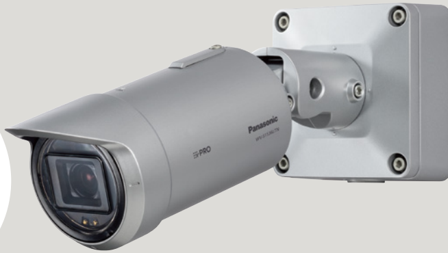
屋外対応 フルHD (1920×1080)