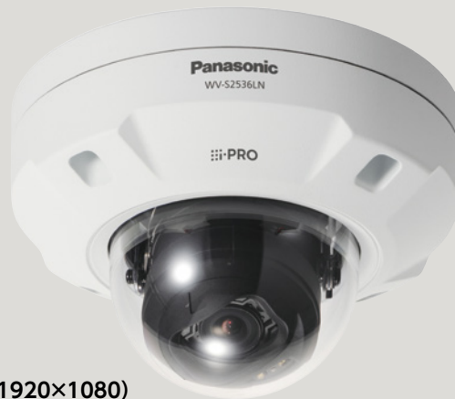
屋外対応 フルHD (1920×1080)