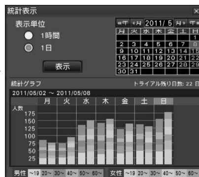
画面イメージ：統計データグラフ表示