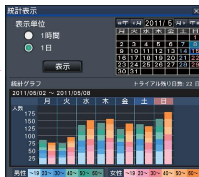
画面イメージ：統計データグラフ表示