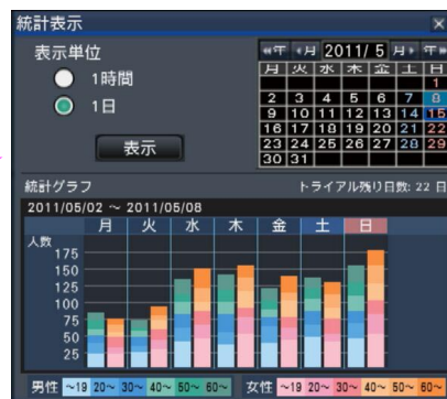
画面イメージ：統計データグラフ表示

※別売りのビジネスインテリジェンス拡張キット（DG-NVF20）のライセンス登録をすることでトライアル期間終了後も継続して統計処理機能が使用できます。