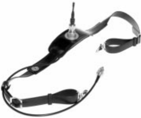
アンテナはWJ-SST200に付属

このたびは、ショルダーキットをお買い上げいただき、まことにありがとうございました。