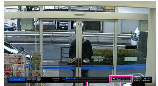
カメラ番号パネル 画面分割ボタン