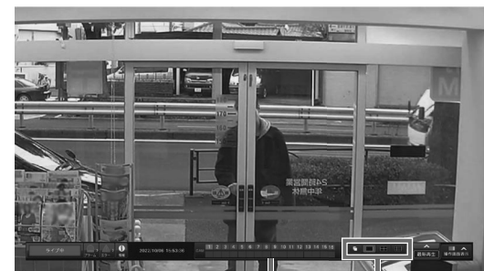
カメラ番号パネル 画面分割ボタン